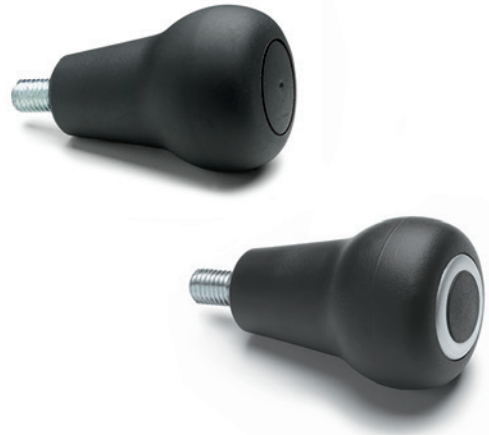
ELESA Original design

IEL+x-H: se zvětšovacími čočkami pro samolepící štítky se značkami a symboly.